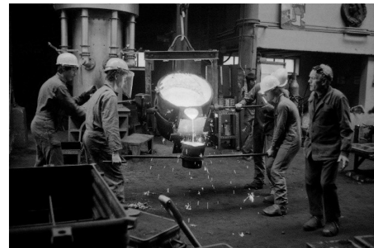
Lycée Ferdinand Buisson Voiron